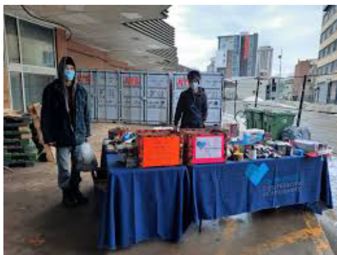
Les Valoristes installés à l'ancienne gare d'autocars

Le quartier a aussi accueilli le nouveau centre de tri pour contenants consignés de la coopérative les Valoristes dans l'ancienne gare d'autocars . L'utilisation de cet espace délaissé par une activité structurée par les personnes faisant la récupération de contenants est particulièrement appréciée dans la dynamique hivernale du quartier.