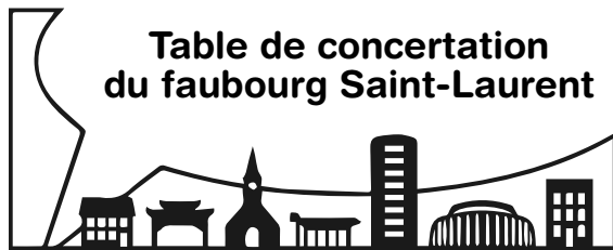
Table de concertation du faubourg Saint-Laurent

1700, RUE ATATEKEN | MONTRÉAL | QC | H2L 3L5 TÉL. 514-288-0404