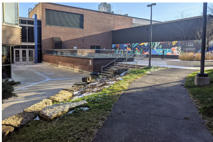
Portion de trajet santé pour la aîné-es qui entrera dans la conception des cartes: l'espace Guy-Rocher au Cégep du Vieux-Montréal

Le projet de cartes imprimées proposant des trajets de marche aux aîné-es s'est également poursuivi. Les propositions de trajet ont été bonifiées en y ajoutant des points d'intérêt sur le patrimoine et l'art, afin que les marcheur-euses apprennent du même coup à mieux connaître le quartier. Plusieurs trajets sont proposés, de différentes longueurs, et adaptés aux saisons. La conception graphique est en cours.