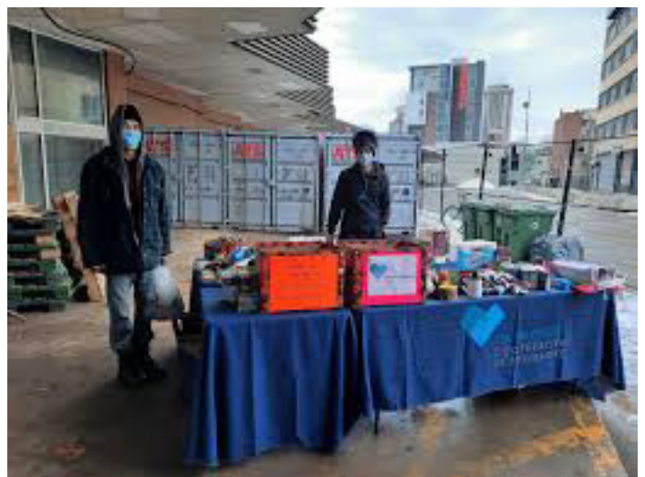
Les Valoristes installés à l'ancienne gare d'autocars

Le quartier a aussi accueilli le nouveau centre de tri pour contenants consignés de la coopérative les Valoristes dans l'ancienne gare d'autocars . L'utilisation de cet espace délaissé par une activité structurée par les personnes faisant la récupération de contenants est particulièrement appréciée dans la dynamique hivernale du quartier.