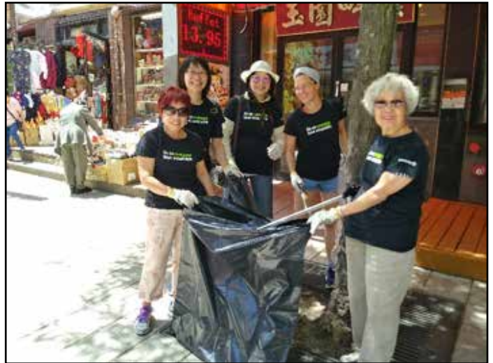
Activité de nettoyage du Quartier chinois (16 juin)

Elle participera également aux réunions de la Santé publique sur l'intégration d'un service «wet» dans la communauté. Un service «wet» s'adresse à des personnes en situation d'itinérance et a comme principales caractéristiques de ne pas exiger la sobriété lors de l'admission, de tolérer l'intoxication à l'alcool ou d'autoriser la consommation d'alcool sur place.