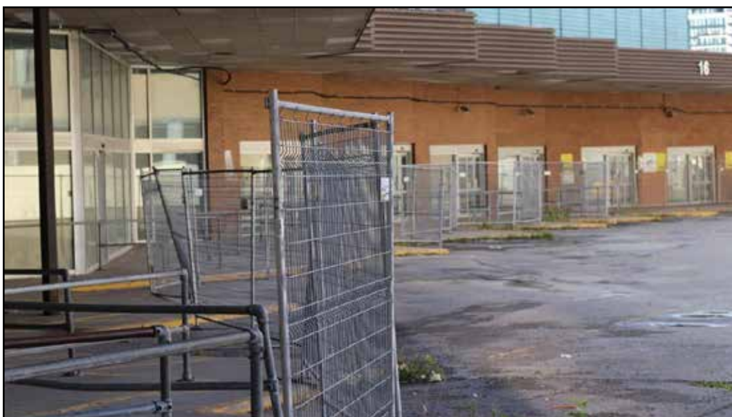
L'ancienne gare d'autobus au coin Berri et de Maisonneuve

La Table aura vraisemblablement à travailler de concert avec l'Arrondissement Ville-Marie dans le projet de redéveloppement de l'ancien terminus d'autobus, une fois celui-ci définitivement acquis par la Ville. L'Arrondissement a annoncé son intention d'en faire un projet répondant aux besoins du quartier. Un groupe de travail devra se mettre sur pied une fois l'acquisition complétée, et la Table compte y jouer un rôle actif pour défendre l'intégration de logements sociaux et de services pouvant desservir la population locale.